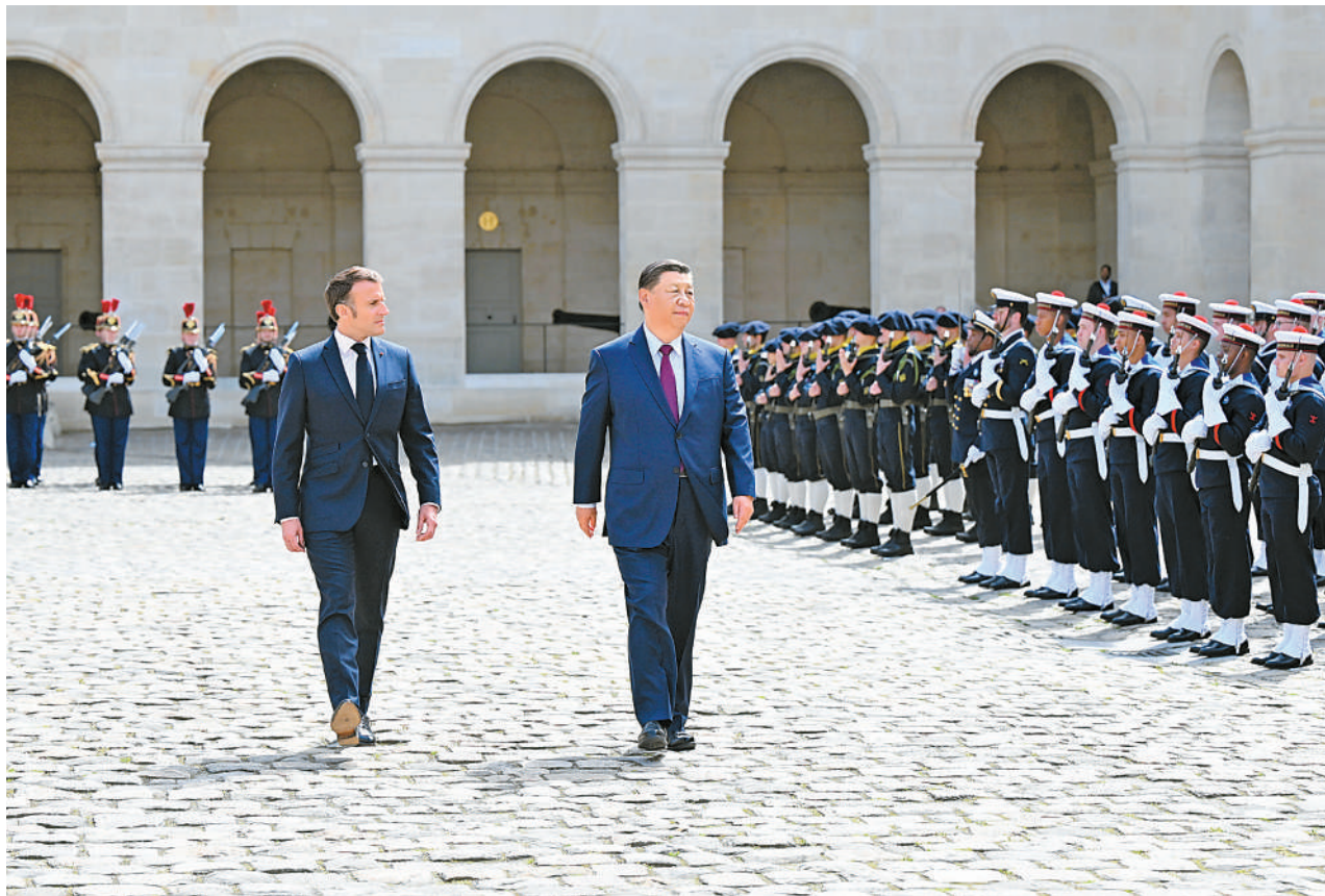
当地时间5月6日下午，正在法国进行国事访问的国家主席习近平在巴黎出席法国总统马克龙举行的隆重盛大欢迎仪式。这是两国元首检阅法兰西共和国卫队和陆海空三军仪仗队。