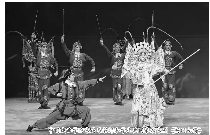
中国戏曲学院京剧系教师和学生共同表演京剧《杨门女将》

面对新时代新使命, 中国戏曲学院作为党和国家培养戏曲事业接班人的高等院校, 必须谨遵“德艺双馨, 继往开来”的校训, 培养造就一大批既有深厚的专业基础知识, 又有跨学科的知识结构和人文素养的戏曲拔尖创新人才, 不断加强对戏曲艺术的理论研究和阐发, 提升戏曲表现生活的能力和手段, 在秉承守正与创新相统一、传统与现代相结合的基础上, 以戏曲美学形态的新创造, 开拓中国戏曲的新境界, 在赓续历史文脉、谱写当代华章的新征程中, 作出中国戏曲学院应有的贡献!