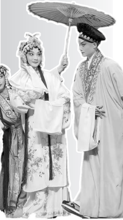
▲ 中国戏曲学院京剧系学生表演京剧《白蛇传》

1959年4月, 为庆祝新中国成立10周年, 刚刚加入共产党的梅兰芳创作了《穆桂英挂帅》。已65岁的梅先生说: “大家都在为国庆献礼而努力, 我也不能例外。”为此, 他放弃了去外地的巡演计划, 在北京仅用两个月的时间创作了这出引人入胜的新编戏。《穆桂英挂帅》是梅兰芳在新中国成立后排演的第一部新戏, 该剧于1959年5月25日在北京人民剧场首演, 连演数场, 剧场爆满, 剧场内掌声雷动。京剧舞台上这个全新的穆桂英形象成为梅兰芳这一生奉献