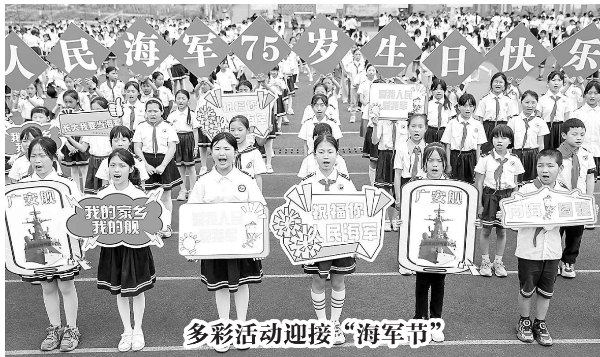
4月17日，由海军上海基地援建的四川省华蓥市高兴镇海军希望小学举行“爱我国防，爱我海军”主题活动，1000余名“小海军”通过聆听退役海军讲“我的海军故事”、为海军叔叔手工制作礼物、表演“长大我要当海军”文艺节目等形式，迎接中国人民解放军海军节。

验，共享数字时代跨境电商发展成果。 “数字丝绸之路”为共建国家经济发展和产业数字化转型带来机遇，与会嘉宾对其“美美与共”的前景充满信心。 津巴布韦信息技术及邮政快递服务部部长丁古穆兹·普提说，“数字丝绸之路”为津巴布韦弥合分歧、促进跨境合作和推动可持续发展提供了前所未有的机遇。 “‘数字丝绸之路’将为所有参与国开启新的进步和繁荣之路。”格鲁吉亚发展基金会首席执行官兼董事会主席贝西克·布贾尼什维利说，格鲁吉亚将用好战略位置，积极投资基础设施建设，推动“数字丝绸之路”取得更大成功。