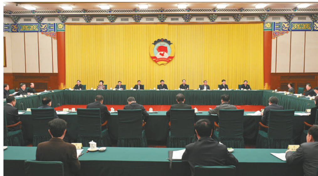
12月7日,十四届全国政协第十四次双周协商座谈会在北京召开,中共中央政治局常委、全国政协主席王沪宁主持会议。

本报(记者 吕巍 徐金玉)十四届全国政协第十四次双周协商座谈会12月7日在京召开,中共中央政治局常委、全国政协主席王沪宁主持会议。他表示,加快建设西部陆海新通道,是中共二十大提出的重大任务,是推进高水平对外开放的重要举措。要深入学习贯彻习近平总书记关于对外开放的重要论述,增强建言资政的针对性和实效性,更好助力加快建设西部陆海新通道,推进我国高水平对外开放。