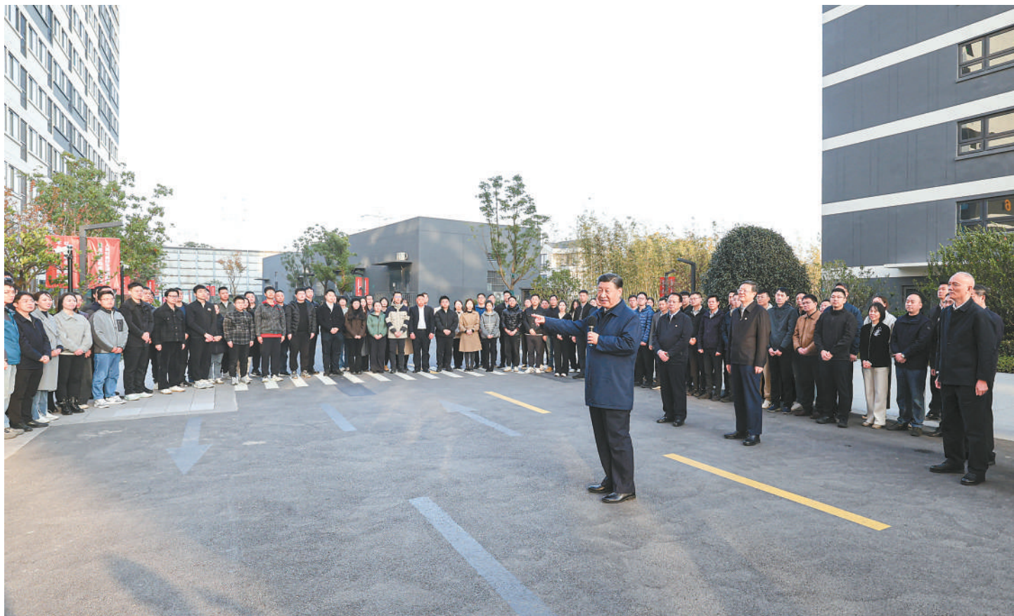
11月28日至12月2日，中共中央总书记、国家主席、中央军委主席习近平在上海考察。这是11月29日下午，习近平在闵行区新时代城市建设者管理者之家，同社区居民亲切交流。

新华社上海/江苏盐城12月3日电 中共中央总书记、国家主席、中央军委主席习近平近日在上海考察时强调，上海要完整、准确、全面贯彻新发展理念，围绕推动高质量发展、构建新发展格局，聚焦建设国际经济中心、金融中心、贸易中心、航运中心、科技创新中心的重要使命，以科技创新为引领，以改革开放为动力，以国家重大战略为牵引，以城市治理现代化为保障，勇于开拓、积极作为，加快建成具有世界影响力的社会主义现代化国际大都市，在推进中国式现代化中充分发挥龙头带动和示范引领作用。 11月28日至12月2日，习近平在中共中央政治局委员、上海市委书记陈吉宁和市长龚正陪同下，先后来到金融机构、科技创新园区、保障性租赁住房项目等进行调研。28日下午，习近平一下车就前往上海期货交易所考察。他结合电子屏幕和重要上市品种交割品展示，听取交易所增强全球资源配置能力、服务实体经济和国家战略等情况介绍，了解交易所日常资金管理和交割结算等事项。习近平强调，上海建设国际金融中心目标正确、步伐稳健、前景光明，上海期货交易所要加快建成世界一流交易所，为探索中国特色期货监管制度和业务模式、建设国际金融中心作出更大贡献。