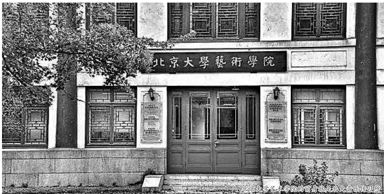
北京大学艺术学院的前身就是北大音乐传习所