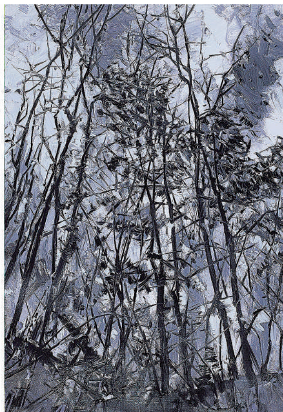
许江(全国政协委员)作