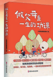
《做父母是一生的功课》 定价：59.80元