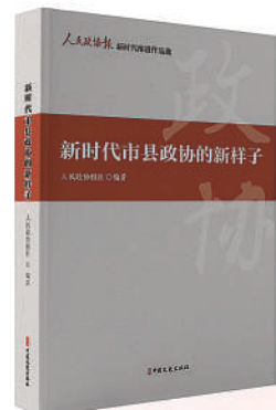
《新时代市县政协的新样子》 单本定价：75.00元