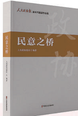
《民意之桥》 单本定价：75.00元