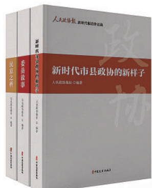
人民政协报新时代报道作品选(全三册)

今年，人民政协报迎来创刊40周年的日子。为此，人民政协报社联合中国文史出版社、中华书局出版了8本精品图书。文章精选自报纸的专栏、专题报道。希望这些图书对各地政协做好新闻宣传工作、讲好履职故事有所帮助，同时，为助力书香政协建设，推动全民阅读作出贡献。