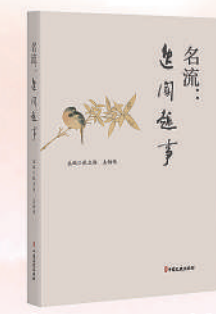
《名流：逸闻趣事》 定价：86.00元

联系地址：北京市海淀区西八里庄路69号人民政协报大厦二层 征订电话：(010) 88146977 (010) 88146970 (010) 88146941