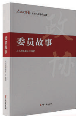
《委员故事》 单本定价：88.00元