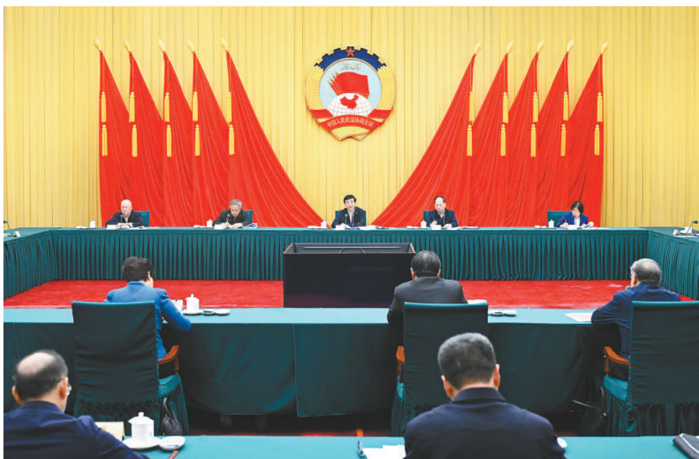
11月17日,政协第十四届全国委员会第十一次主席会议在北京召开。中共中央政治局常委、全国政协主席王沪宁主持并讲话。