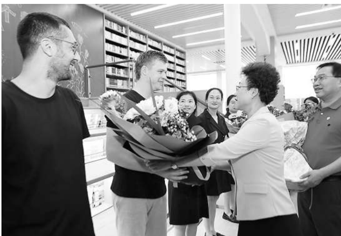
▲九月五日,深圳市政协教育界别在深州市政协向该校一线教师代表送上节日的问候。

计划与行动 “我本人一直参加各种各样的送教下乡活动,发现乡村教师有强烈的成长渴望,但限于资源、环境、认识的局限,他们没有打破现状的能力。”“每年的继续教育很多,但处在最底层最边缘的乡村教师常常轮不到,即使有,多数时候也只是作为“听众”被动的听,很少有参与的机会。”“为什么我们不能针对他们、为了他们,特别提供有价值的培训?”——一个想法在兰臻心里萌生。“我想打开一个缝隙,让阳光照进来,让种子发芽。” 于是“乡村种子教师培养计划”在兰臻心里悄然萌生。 “从提升乡村教师的素质入手!我们要精心培育一批像种子一样的教师,撒下去,能够带动一批,成长一片!” 2013年,漳州市教育局支持兰臻成立“漳州市兰臻名师工作室”,同年兰臻带着对乡村教育和乡村教师队伍建设的思考,在福建省党代会上汇报了自己的构想,获得了省委、省政府的高度